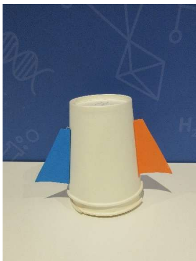
B1:「身近なもので ロケットをつくろう」